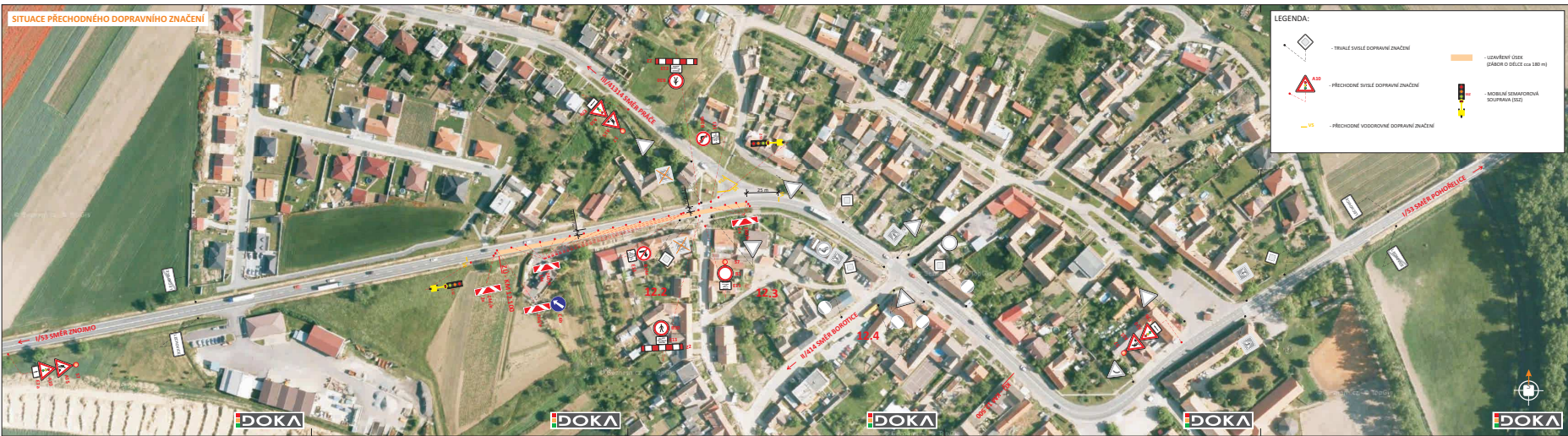
SITUACE PŘECHODNÉHO DOPRAVNÍHO ZNAČENÍ